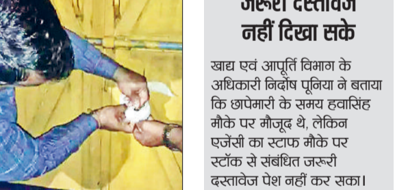
फतेहाबाद। टोहाना में गैस एजेंसी को सील करते विभाग के कर्मचारी।