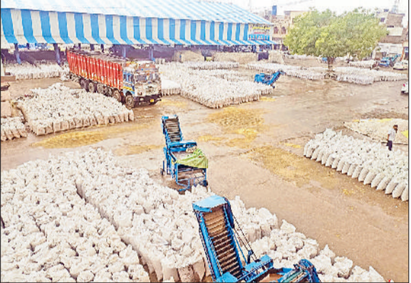
फतेहाबाद। बरसात से मंडियों में भीगा गोहूँ।

तेज धूप के बाद गोहूँ सूखेगी और उसके बाद ही कटाई शुरू हो पाएगी