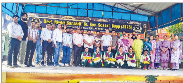
ओढ़ा। मेधावी विद्यार्थियों को सम्मानित करते हुए।