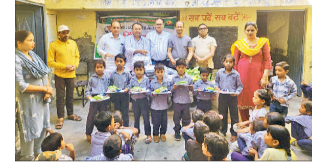
सिरसा। विद्यार्थियों को स्टेशनरी वितरित करते हुए।

चिकित्सकों और कर्मचारियों को समय पर अपनी ड्यूटी पर उपस्थित होने के निर्देश दिए। उन्होंने विशेष रूप से मैटर्निटी और चाइल्ड वार्ड में मरीजों को प्रदान की जा रही बेहतरीन सुविधाओं को सही पाया।