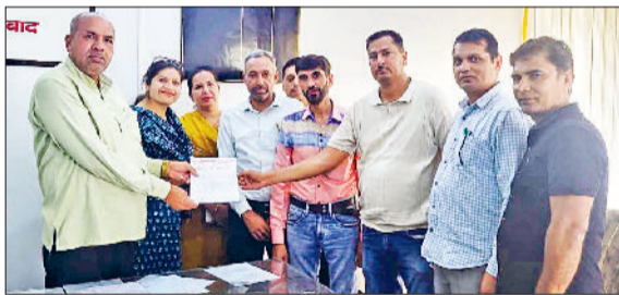
फतेहाबाद। खंड शिक्षा अधिकारी को ज्ञापन सौंपते अध्यापक संघ के पदाधिकारी।