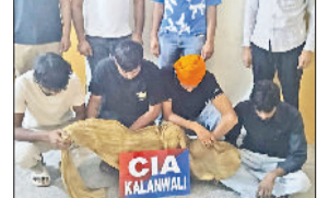
सिरसा। हेरोइन के साथ पकड़े गए आरोपी पुलिस की गिरफ्त में।